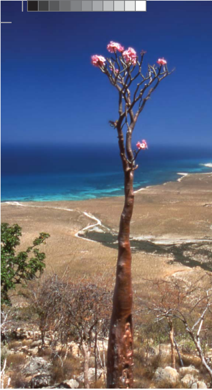
▲ Sokotra çöl gülü