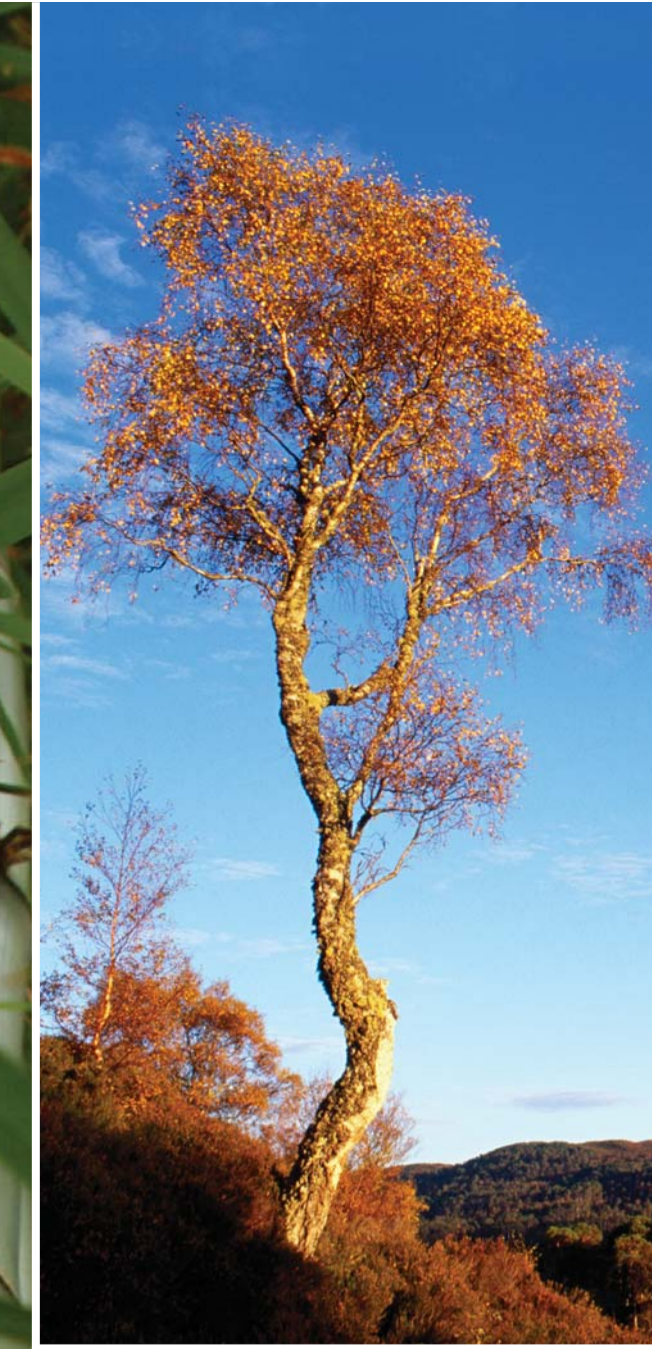
▲ Huş ağacı