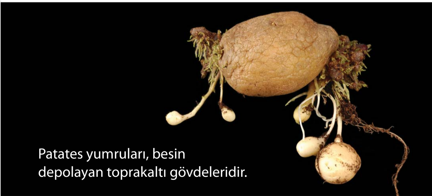
Patates yumruları, besin depolayan toprakaltı gövdeleridir.