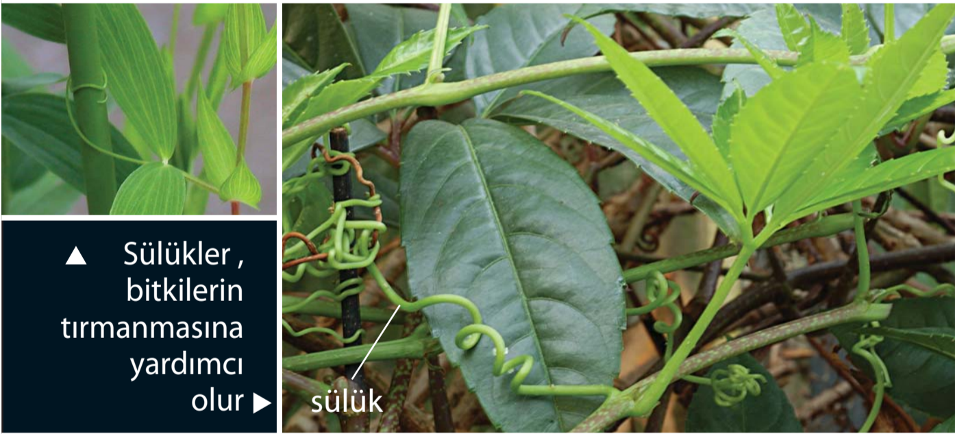
▲ Sülükler, bitkilerin tırmanmasına yardımcı olur ▶

Gövde, su depolamak için kullanılabilir.