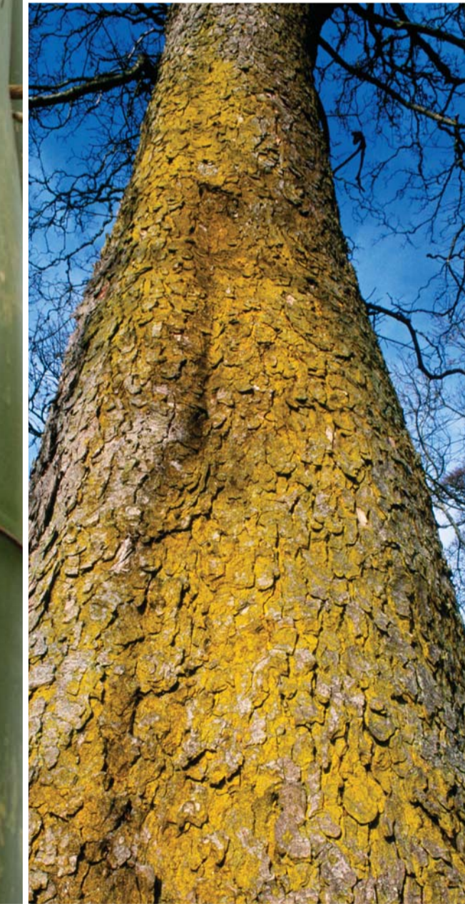
▼ Amerikan çınarı