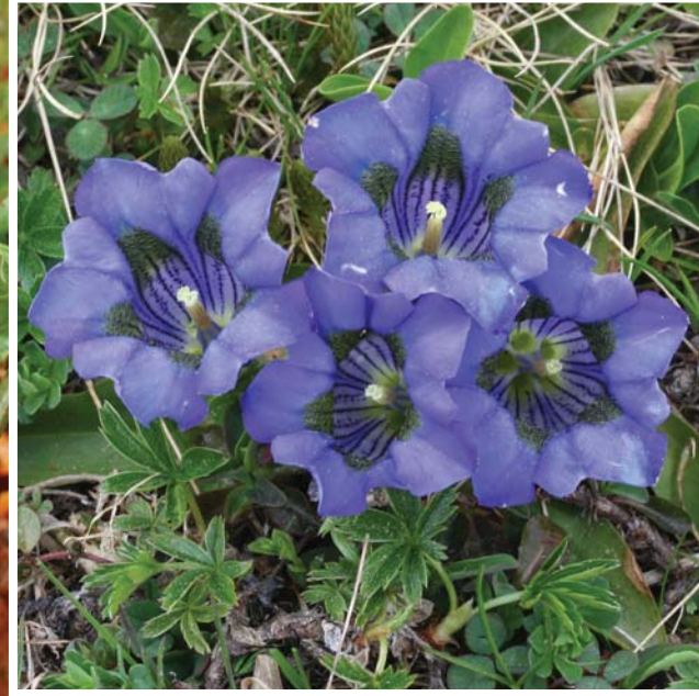
◀ Yı lanyastığı