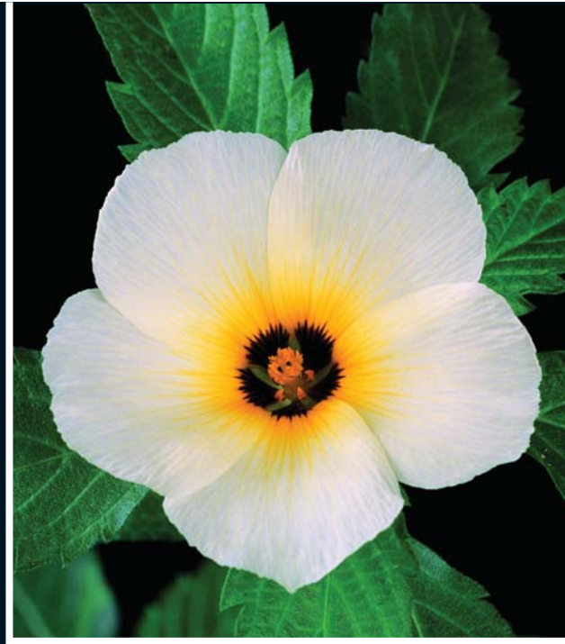
▲ "Turnera ulmifolia"

Tohum taslakları, dişi eşey hücrelerini içerir ve tohumlara dönüşür. Çiçektozları, erkek eşey hücrelerini içerir.