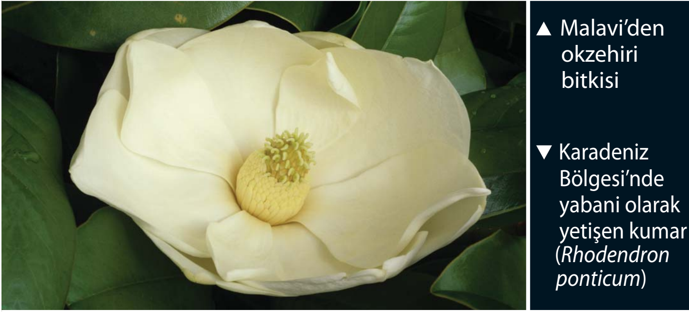
▲ Malavi'den okzehiri bitkisi