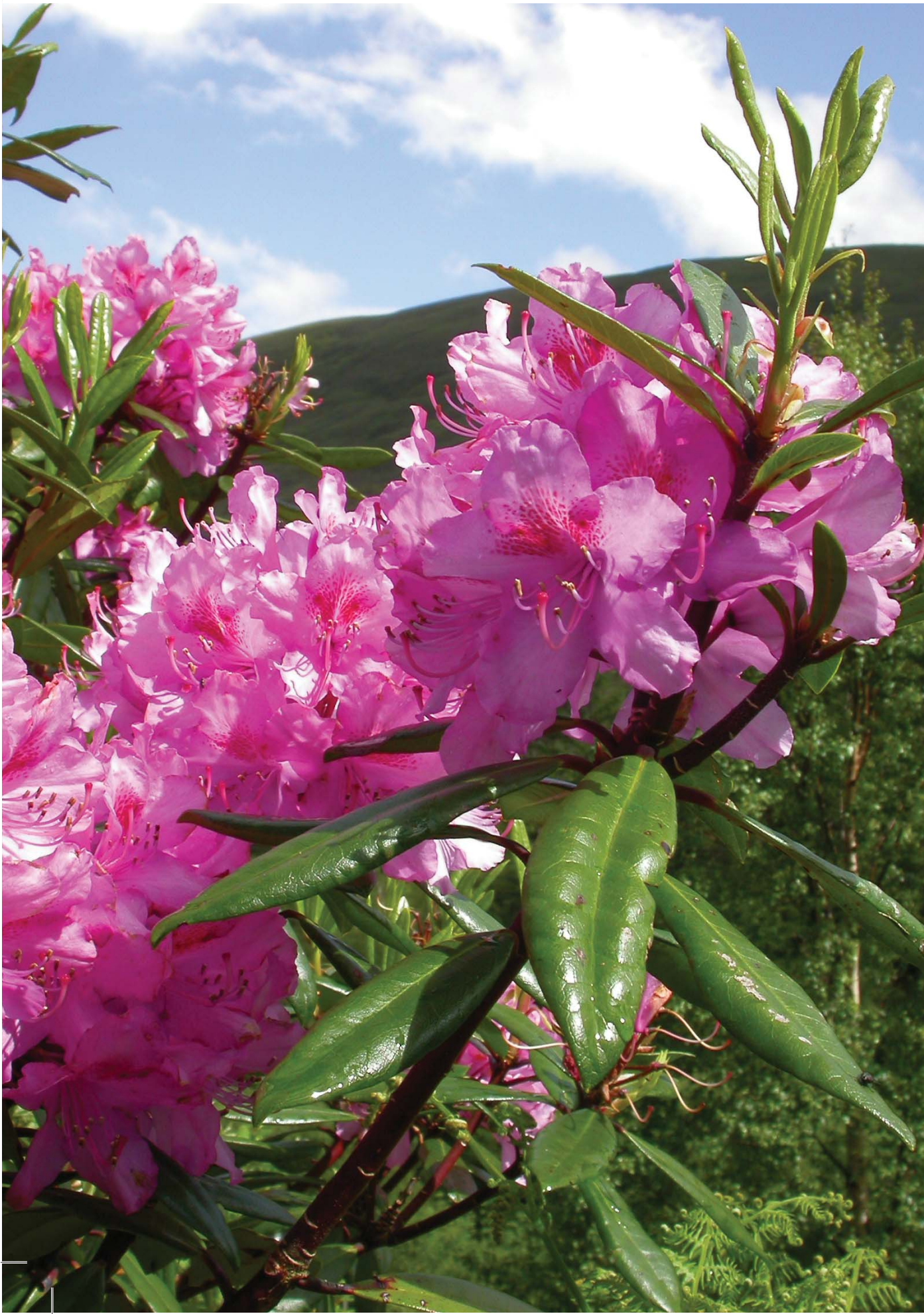
▼ Karadeniz Bölgesi'nde yabani olarak yetişen kumar ( Rhodendron ponticum )