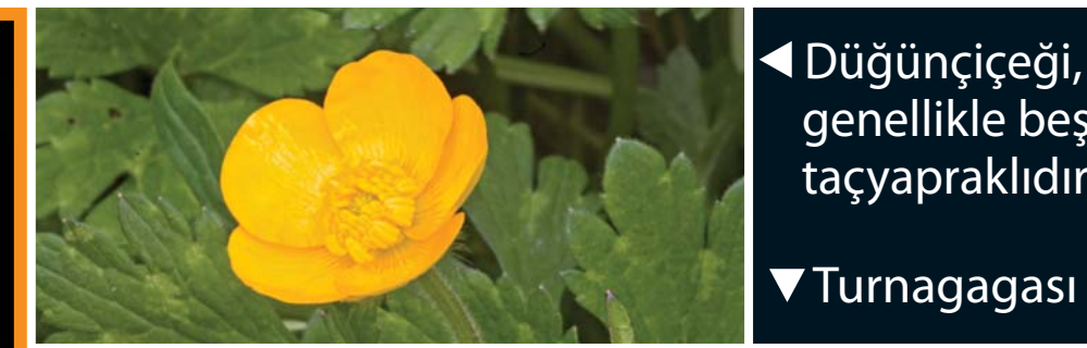
◀ Düğünçiçeği, genellikle beş taçyapraktır.

? Bu yaprakların, tümünün ortak özelliği nedir?