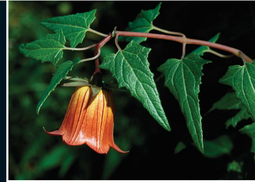
▲ Kanarya Adası çançiçeği

? Bu yaprakların, tümünün ortak özelliği nedir?