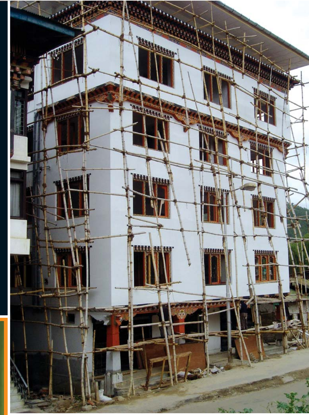
▲ Butan' da, bambudan yapı iskelesi.

Bambular büyük bitkilerdir; bazı türleri çok hızlı gelişir ve 30 m'ye kadar boylanır.